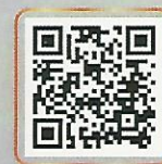
สารคดีสั้น เรื่อง "ผมเป็นราษฎร ที่ไม่มีสิทธิเลือกตั้ง"