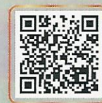
สแกน QR CODE เพื่อรับชมวิดีโอทั้งหมด