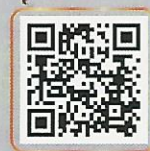
สารคดีสั้น เรื่อง "เวนคืน ไม่ใช่ขบวนการ"