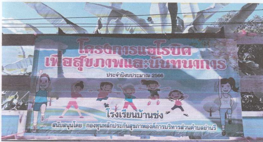
ภาพประกอบการดำเนินโครงการแอโรบิคเพื่อสุขภาพและนันทนาการ