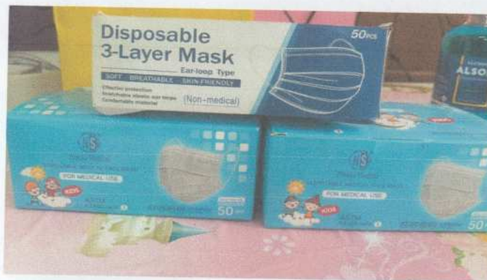
แชมพูกำจัดเหา ถุงมือยาง หมวกคลุมผม และหน้ากากอนามัย