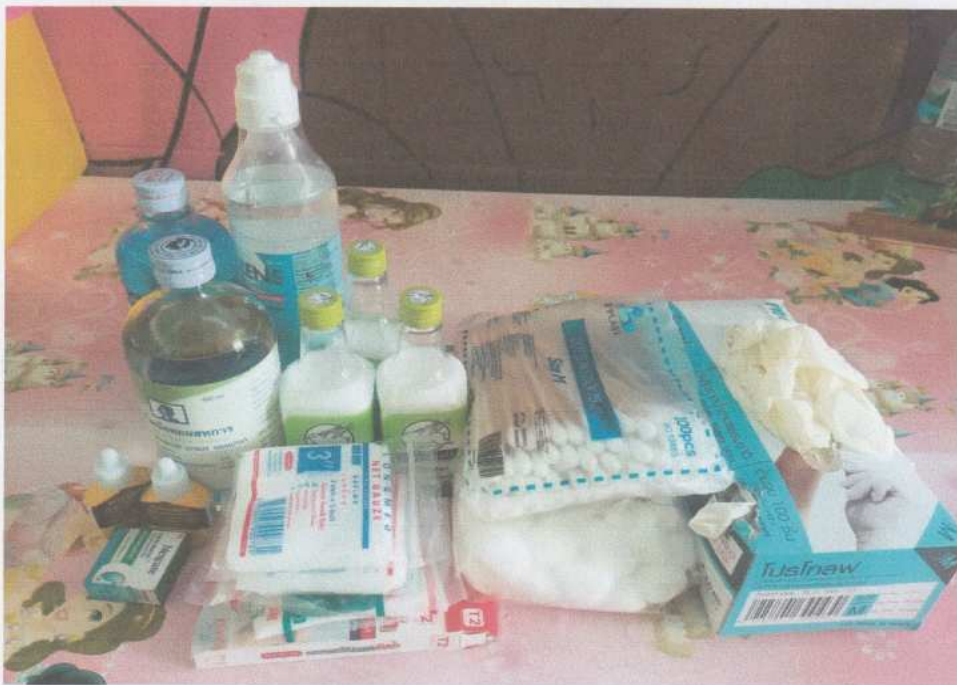
ยาและเวชภัณฑ์ในการปฐมพยาบาล