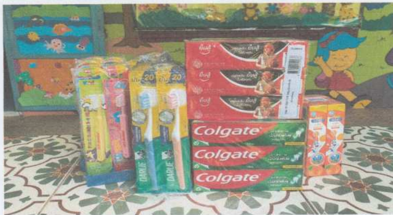
แปรงสีฟันและยาสีฟัน