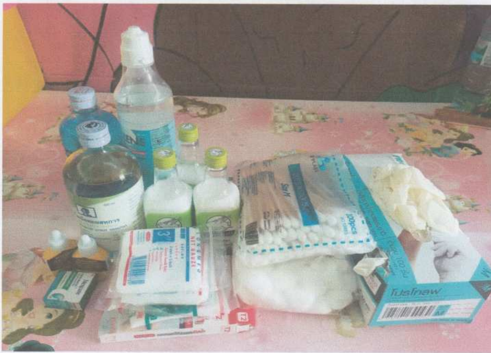
ยาและเวชภัณฑ์ในการปฐมพยาบาล