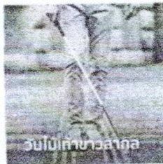
ไม้เท้าขาว