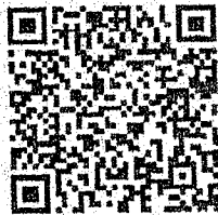
ลิงก์การรับฟังความคิดเห็นเพื่อประเมินผลสัมฤทธิ์ของพระราชบัญญัติภาษีที่ดินและสิ่งปลูกสร้าง พ.ศ. ๒๕๖๒